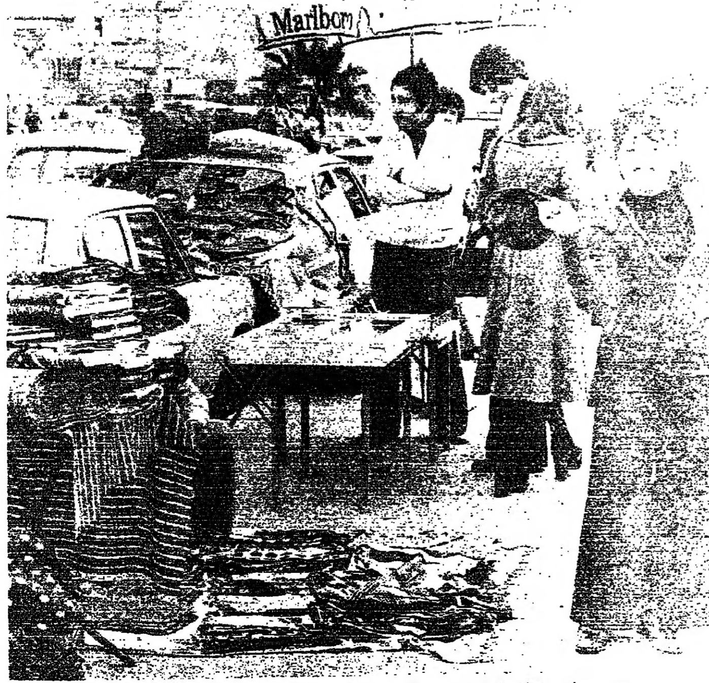
■ عكس من كل شيء